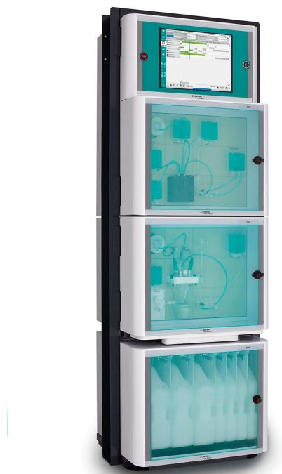
Figure 2. 2060 TI Process Analyzer para análise on-line de parâmetros críticos de qualidade em banhos de decapagem usando o método de titulação.

os custos operacionais e de descarte de produtos químicos são consideravelmente reduzidos. Metrohm Process Analytics oferece um analisador de processo multiparâmetro adequado para análise simultânea de \text{Fe}^{2+}/\text{Fe}^{3+} e relação ácido livre/ácido total em uma ampla faixa de concentração - o Analisador de Processo 2060 TI (Figura 2) .