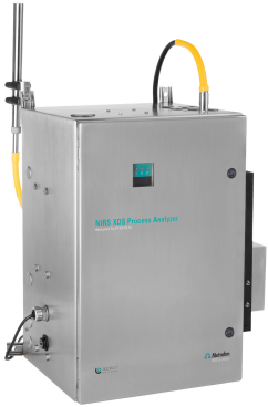
Figure 2. NIRS XDS Process Analyzer from Metrohm Process Analytics.

consente di risparmiare tempo e denaro e il miglioramento della qualità del prodotto può portare a profitti ancora più elevati per il produttore.