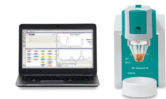
Figure 1. 884 VA Profesional

Primero, las muestras se mineralizan por incineración seca en un horno a 450 °C durante 16 horas. Luego, la ceniza restante se disuelve en una pequeña cantidad de ácido nítrico concentrado y se diluye con agua ultrapura. La determinación de cadmio se lleva a cabo en el 884 Professional VA con el Multi-Mode Electrode pro como electrodo de trabajo utilizando los parámetros enumerados en Tabla 1 . La concentración de Cd se determina mediante dos adiciones de solución de adición estándar de Cd.