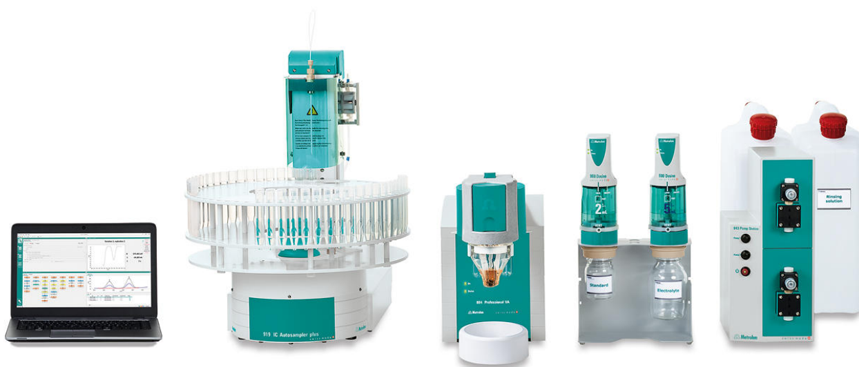
Figure 1. 884 Professional VA completamente automatizado para VA

El electrodo Bi drop se activa electroquímicamente antes de la primera determinación.