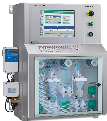
Figure 2. El analizador de procesos a prueba de explosiones 2045TI está certificado para áreas de Zona 1 y Zona 2.