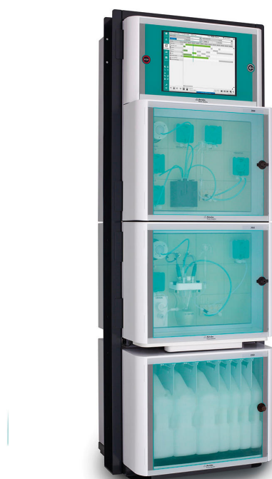
Figure 2. 2060 TI Process Analyzer para el análisis en línea de parámetros críticos de calidad en baños de decapado mediante el método de valoración.

productos químicos se reducen considerablemente. Metrohm Process Analytics ofrece un analizador de procesos multiparamétrico adecuado para el análisis simultáneo de \text{Fe}^{2+}/\text{Fe}^{3+} y de la relación ácido libre/ácido total en un amplio rango de concentraciones: el analizador de procesos 2060 TI (figura 2).