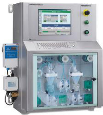
Figure 2. ADI 2045TI Ex proof (ATEX) Analyzer.

El cloruro se analiza con detección de conductividad como se describe en ASTM D3230 con el analizador a prueba de explosiones ADI 2045TI (Figura 2).