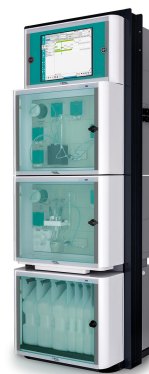
Figure 2. El analizador de procesos 2060 TI es adecuado para monitorear PAN durante la producción de caprolactama.

Las impurezas oxidables se controlan en caprolactama según ISO 8660 para fines en línea, con mediciones colorimétricas precisas controladas por tiempo y temperatura. Metrohm Process Analytics ofrece una solución de analizador de procesos multiparamétrico para medir con precisión PAN en línea según la norma ISO 8660: el Analizador de procesos TI 2060 (Figura 2) .