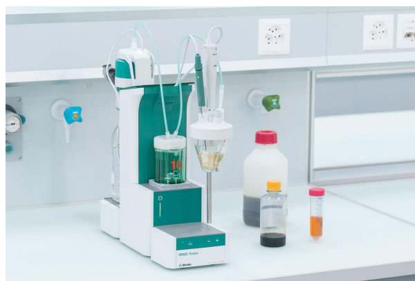
Figure 1. 859 Titrotherm con tiamo. Configuración de ejemplo para la titulación termométrica de hierro ferroso.

resultados se resumen en tablas 1 , y se muestra una curva de titulación de ejemplo en Figura 2 .