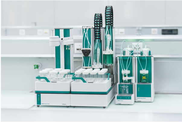
Figure 1. OMNIS Sample Robot S equipado con un valorador OMNIS, un módulo de dosificación OMNIS y dSolvotrode para la determinación automática de TAN y TBN en muestras de aceite de motor.

etiquetado como aceite mineral. No se requiere preparación de muestras.