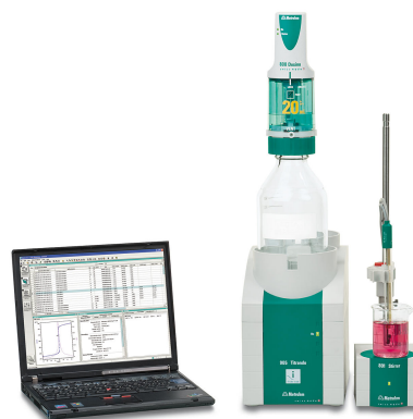
Abbildung 1. 905 Titrando mit tiamo. Beispielaufbau für die Bestimmung von Vitamin C.

Eine Blindwertbestimmung wird auf die gleiche Weise durchgeführt.