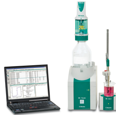
Abbildung 1. Titrand-System bestehend aus einem 907-Gerät in Kombination mit tiamo.

Die Analysen werden mit einem Titrand 907 durchgeführt, der mit einer Solvotrode easyClean ausgestattet ist. Ein Aliquot der Extraktionslösung wird in ein Becherglas überführt, mit Ethanol aufgefüllt (um die Glasmembran und das Diaphragma der Elektrode zu tränken) und dann mit standardisierter Perchlorsäure in Eisessig titriert, bis der erste Äquivalenzpunkt erreicht ist.