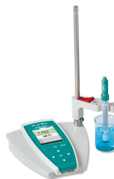
Figure 1. 913 pH-Meter, ausgestattet mit einer pH-Elektrode. Beispielaufbau zur Bestimmung des pHe-Wertes.

Eine definierte Probenmenge wird in ein 100-mL-Becherglas gegossen und auf eine externe Rührplatte gestellt. Die EtOH-Trode und der Temperatursensor werden eingetaucht und die Messung wird sofort gestartet. Der Wert nach 30 Sekunden gilt als Säurestärke der Probe.