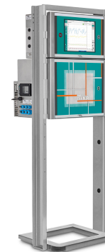
Abbildung 3. Der 2060 The NIR-Ex Analyzer von Metrohm Process Analytics.

Der 2060 The NIR-Ex Analyzer (Abbildung 3) ermöglicht den Vergleich von «Echtzeit»-Spektraldaten aus dem Reforming-Prozess mit einer primären Methode (z. B. Cooperative Fuel Research «CFR»-Tests), um ein einfaches, aber unverzichtbares Kalibriermodell für die OZ-Überwachung zu erstellen. Jeder Metrohm Process Analytics 2060 The NIR-Ex Analyzer ist für Anwendungen in ATEX-Zonen ausgerüstet. Mit einem einzigen Prozessanalysator lassen sich dank der Multiplexer-Option bis zu 5 Messstellen pro NIR-Kabinett überwachen. Eine Erweiterung ist auf bis zu 10 Messstellen mit einer einzigen Auswerteeinheit möglich.