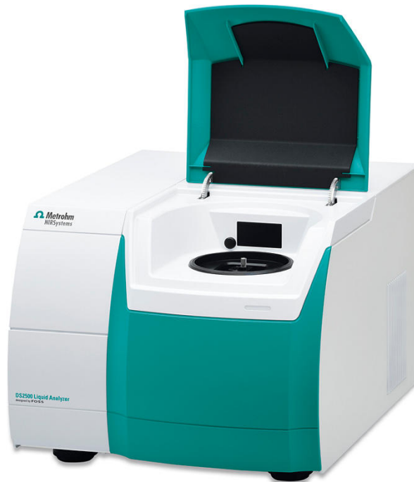
Abbildung 1. Metrohm NIRS DS2500 Flüssigkeitsanalysator zur Messung der Jodzahl in Sojabohnen-Palmöl-Mischungen.