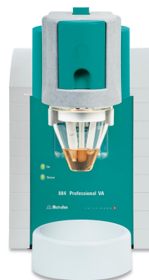
Abbildung 1. 884 Professional VA, manuelles Messsystem unter Verwendung der MME pro.

Die LFP-Probe wird eingewogen, mit entgaster verdünnter Schwefelsäure vermischt, 15 Minuten lang auf 85 °C erhitzt und danach abgekühlt. Anschließend wird die aufgeschlossene Probenlösung in das Messgefäß zugegeben, das bereits 20 mL entgasten Elektrolyten enthält. Die Quantifizierung erfolgt mittels zweier Standardzugaben mit separaten Fe(II)- und Fe(III)-Lösungen.