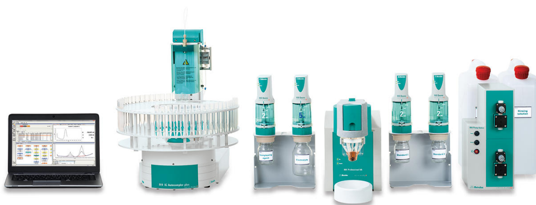
Abbildung 2. 884 Professional VA, vollautomatisiert für voltammetrische Analysen