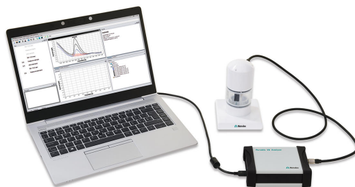
Abbildung 1. 946 Portable VA Analyzer (scTRACE Gold-Version)

Die scTRACE Gold-Elektrode wird vor der ersten Bestimmung elektrochemisch aktiviert. Im nächsten Schritt werden die Wasserprobe und der Grundlektrolyt in das Messgefäß pipettiert. Die Bestimmung von Bismut erfolgt mit dem 884 Professional VA oder mit dem 946 Portable VA Analyzer unter Verwendung der in Tabelle 1 angegebenen Parameter. Die Konzentration wird durch zweimalige Zugabe einer Bismut-Standardlösung bestimmt.