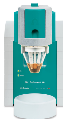
Abbildung 1. 884 Professional VA, manuelles Messsystem unter Verwendung der MME pro.

10 mL oxidierte Natriumchlorid-Soleprobe und 2 mL Reinstwasser werden in das Messgefäß zugegeben. Die Bestimmung von Iodid erfolgt mit dem 884 Professional VA (Abbildung 1) unter Verwendung der in Tabelle 1 angegebenen Parameter. Die Konzentration wird durch zwei Zugaben einer Iodat-Standardlösung bestimmt.