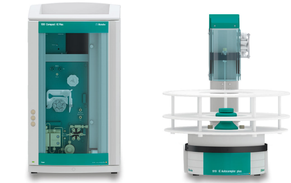
Abbildung 1. Instrumenteller Aufbau mit einem 930 Compact IC Flex mit IC Leitfähigkeitsdetektor und einem 919 IC Autosampler plus.

Die Proben wurden direkt ohne weitere Probenvorbereitung in den Ionenchromatographen (Abbildung 1) injiziert und unter Verwendung der in der USP-Monographie angegebenen Methodenparameter (Tabelle 1) analysiert. Die Anionen wurden isokratisch auf einer Metrosep A Supp 1 - 250/4.0 Säule getrennt, die das alternative Packungsmaterial L46 enthält. Die Detektion erfolgte nach sequenzieller Suppression mittels Leitfähigkeit.